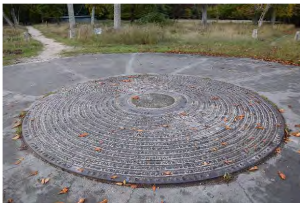
L'Oeil des Nations installé à Franchard en 1998 lors du 50 ème anniversaire de la création de l'UICN.

Les Réserves Biologiques Intégrales prolongent les Séries Artistiques créées en 1853 sous l'impulsion des peintres de Barbizon, Th. Rousseau et JF. Millet. Ces reliques de forêt naturelle, foisonnantes de vie, furent les premiers espaces au monde à recevoir un statut de protection. Depuis lors, Fontainebleau demeure un lieu emblématique de la protection de la nature, comme le réaffirmèrent en 1948 les États et membres fondateurs de l'Union Internationale de Conservation de la Nature (UICN) réunis à Fontainebleau.