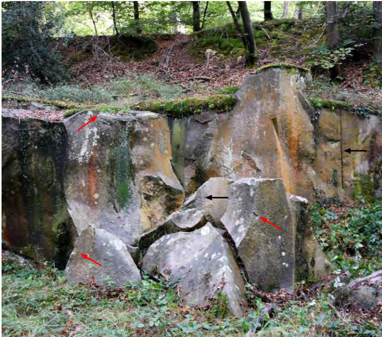
Front de taille avec traces de barre à mine (flèches noires) et traces de mortaise (flèches rouges).

La platière de grès du Rocher du Long Boyau est l'une des multiples platières exploitées au cours des siècles pour servir à la construction et au pavage des rues. Exploitée dans la seconde moitié du XIX e siècle, la carrière, ou plutôt les carrières, sont bien préservées et permettent d'expliquer les techniques utilisées et de décoder le paysage lors de l'exploitation.