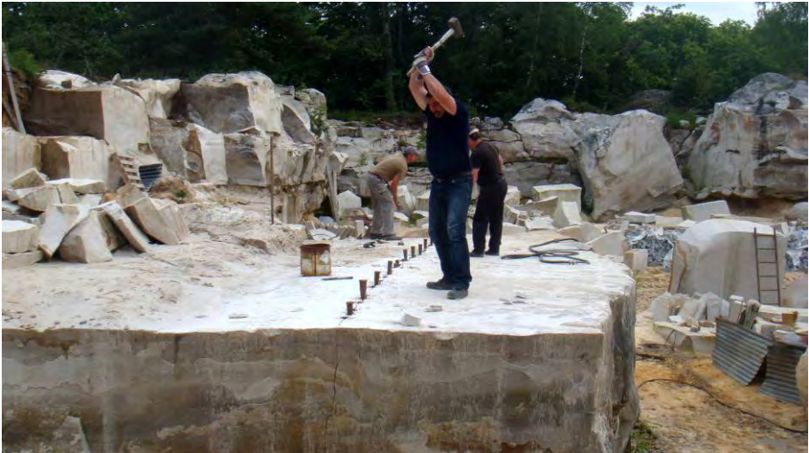
Abattage d'un bloc par la méthode des coins, carrière Établissements Les Grès de Fontainebleau & Cie, Moigny-sur-École.

L'exploitation du grès a atteint son apogée dans la première moitié du XIX e siècle avec la généralisation du pavage des rues. En 1846, 340 carriers étaient recensés en forêt de Fontainebleau, auxquels il faut adjoindre terrassiers, journaliers, compagnons, voituriers, forgerons ; le tout représentant environ 1 000 emplois dans les moments de forte commande. L'activité déclina avec l'avènement du chemin de fer qui permit des approvisionnements plus diversifiés et plus lointains.