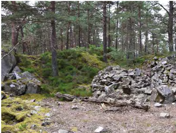
Champs d'écales (rebuts) à l'avant du front de taille.